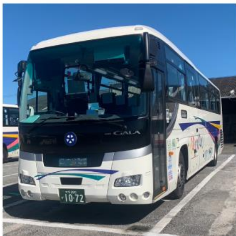
大分交通株式会社

本サービスにおきまして、クレディセゾンはタッチ決済の導入の支援を行い、インバウンド観光客を含む国内移動における利便性の向上に努めてまいります。