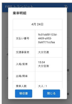
乗車明細・領収書発行画面