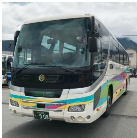
亀の井バス株式会社