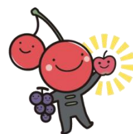
「ニキボー」 仁木町マスコットキャラクター

※市町村運営有償運送とは、地域住民の移動手段を確保するために市町村が運送を行うものです。「ニキバス」は仁木町が運営する予約制の有料バスです。